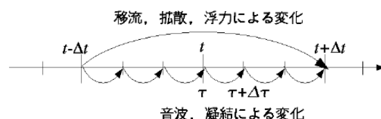
図 1.2: モード別時間分割法の概念図。北守 (2006) より引用した。

凝結に関連する項は音波にも移流にも直接関連しないので, 解くべき時間ステップは凝結の時間スケールによって決まると考えられる。北守 (2006) は Odaka et al. (1998) の火星乾燥対流の実験結果をもとに CFL 条件を満たす長い時間ステップと短い時間ステップの最大値をそれぞれ 5.0 [s], 0.5 [s] と見積もった。また北守 (2006) は流れの存在しない火星大気での拡散成長についての数値計算を行ない, 凝結の時間ス